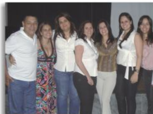
Representantes do CRF-ES e da Vigilância que contribuíram para a realização do evento.

legais necessários às farmácias e drogarias; a necessidade de um espaço com privacidade, conforto e estrutura necessária para realização dos serviços farmacêuticos; obrigatoriedade de exposição de cartaz com orientações relativas aos riscos da automedicação; dispensação de medicamentos por meio remoto (telefone, fax, internet). Além disso, a Resolução permite às farmácias e drogarias a realização dos serviços farmacêuticos: atenção farmacêutica domiciliar, aferição de pressão, temperatura corporal e glicemia capilar, aplicação de medicamentos injetáveis e colocação de brincos.